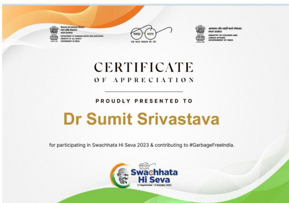
Figure 8. Participated in Swachhta Hi Seva 2023.