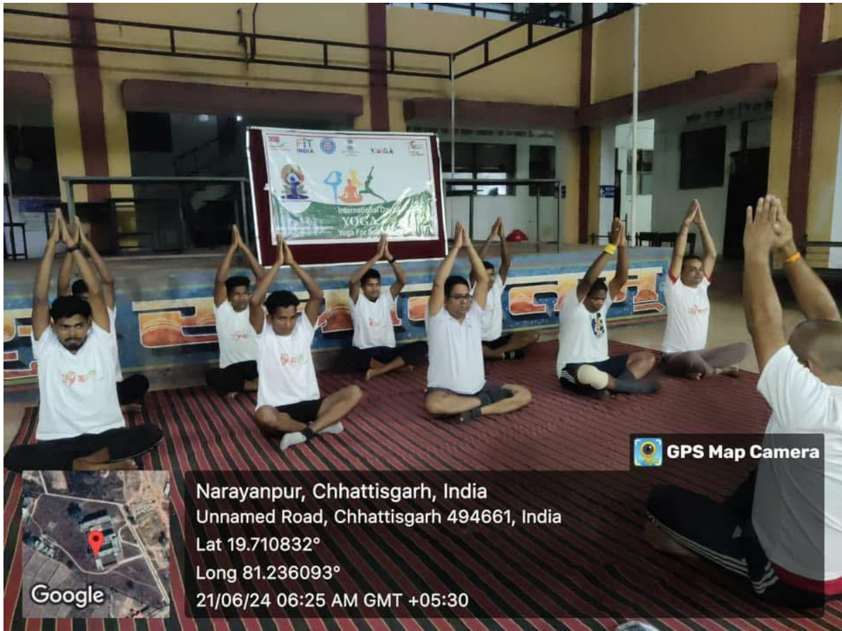
Figure 4. Yoga activity in college dated 21/06/2024.