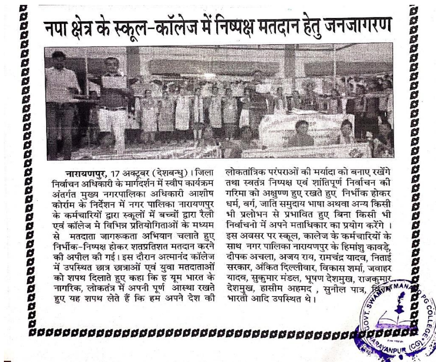
Figure 12. Voter id link with Aadhaar Card Campaign through SVEEP