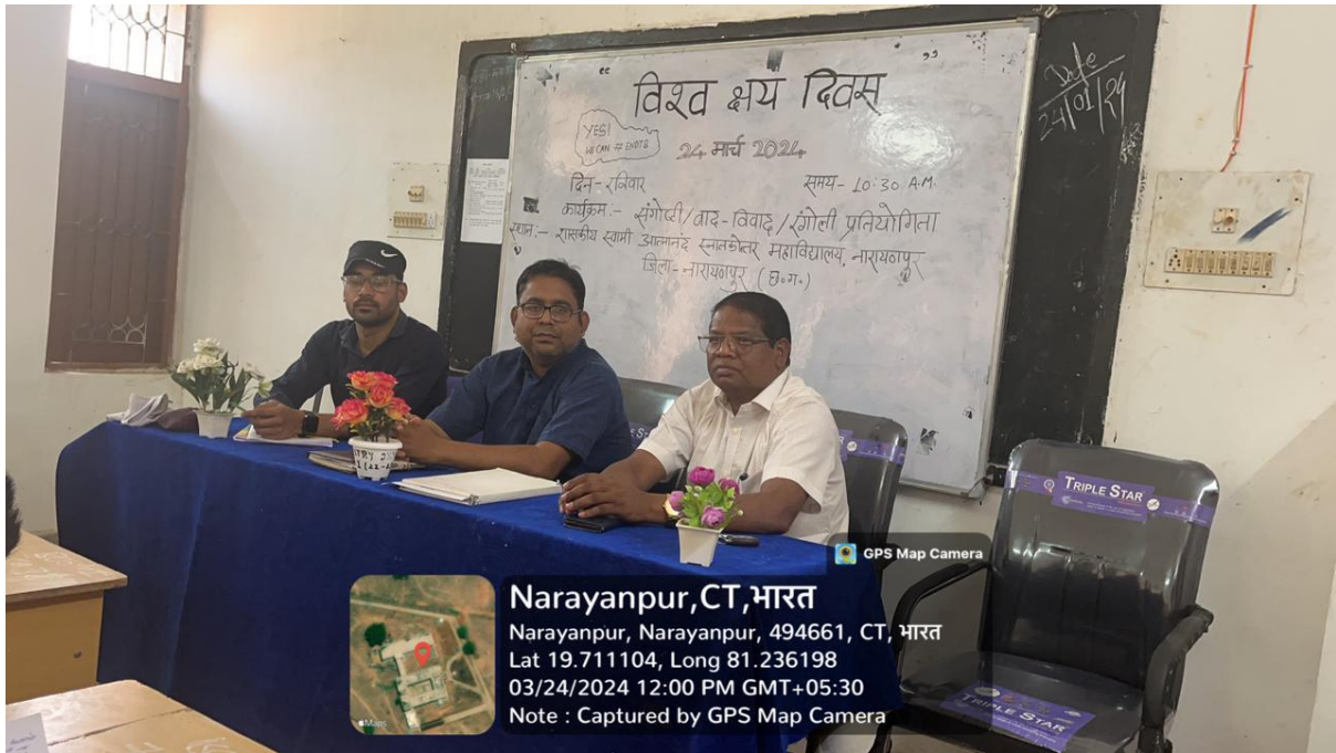
Figure 9. Awareness program on TB dated 24/03/2024.