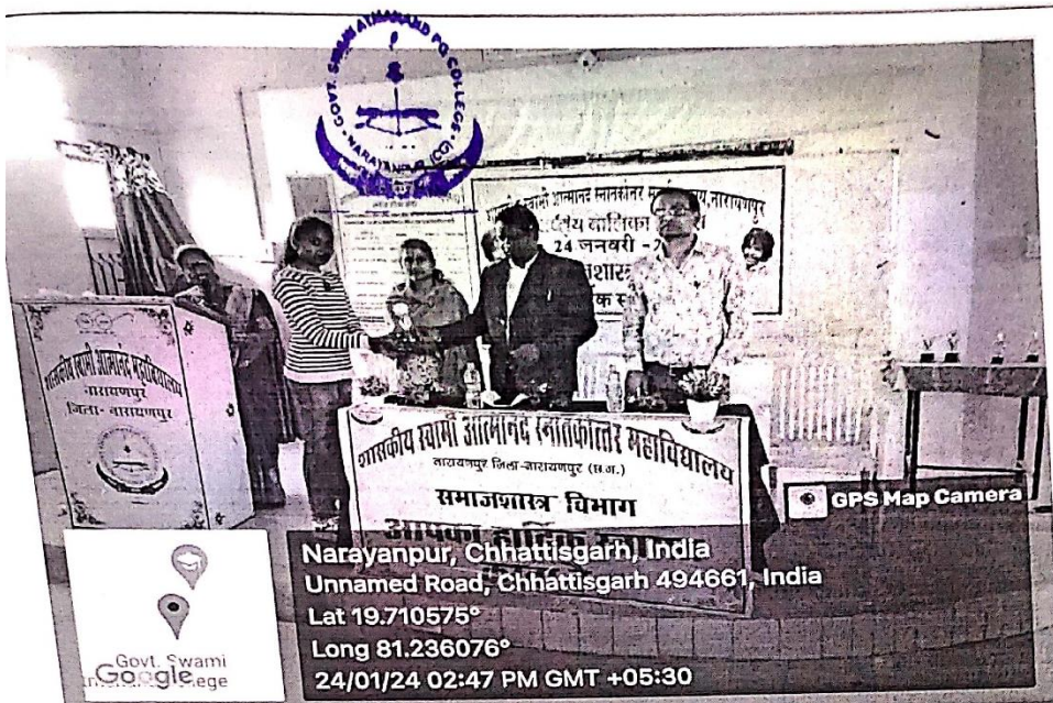
Figure 10. National Girls Day through Arts Departments dated 24/01/2024.