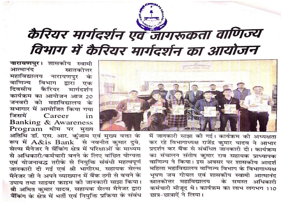
Figure 11. Carrier Guidance Program through Commerce Department dated 20/01/2024