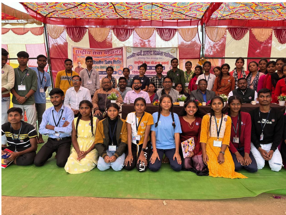
Figure 3. NSS Camp in village area dated 1/1/2024 to 11/01/2024.