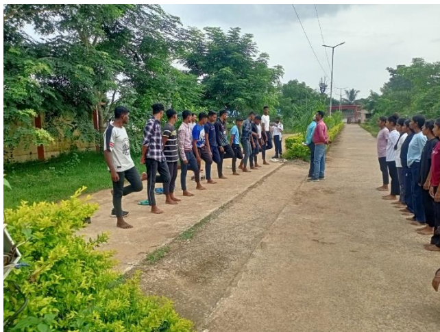
Figure 5. Physical activity through NCC.

NCC also contributes in the field of social services. NCC popularises yoga, cleanliness and digital awareness in the country. NCC is spreading awareness in the field of environment, health and during the election process they take proactive action through rallies, awareness, street play etc. These activities encourage cdeTs to participate voluntarily within their communities and neighbourhood.