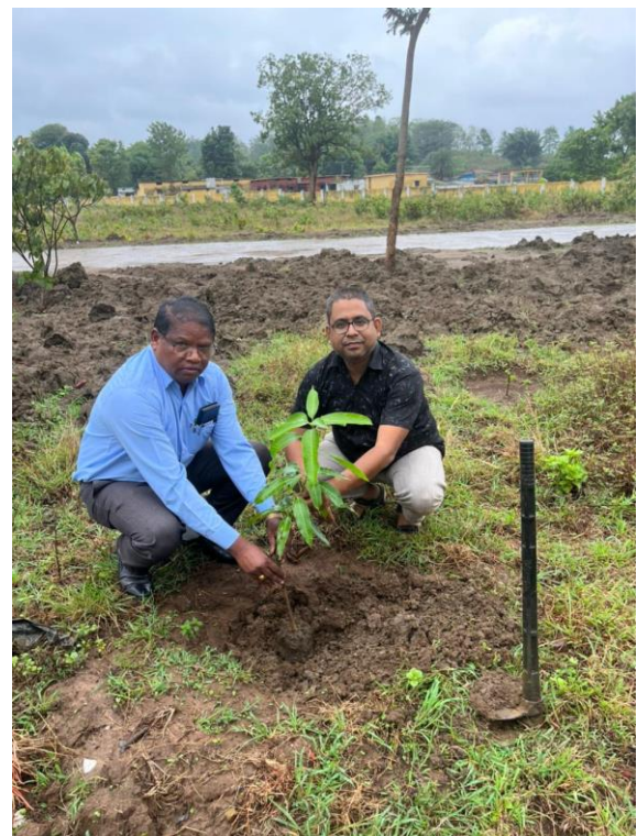
Figure 1: Plantation activity in college dated 05/06/2024.